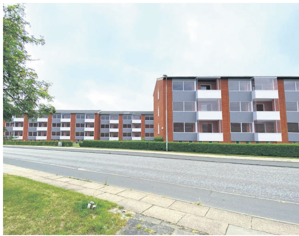
Helhedsplanen omfatter renovering af facader. Altanererne vil blive lukket med en glasinddækning. Visualiseringen er vejledende.