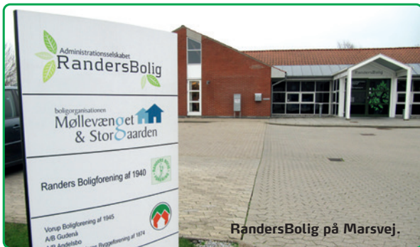
RandersBolig på Marsvej.