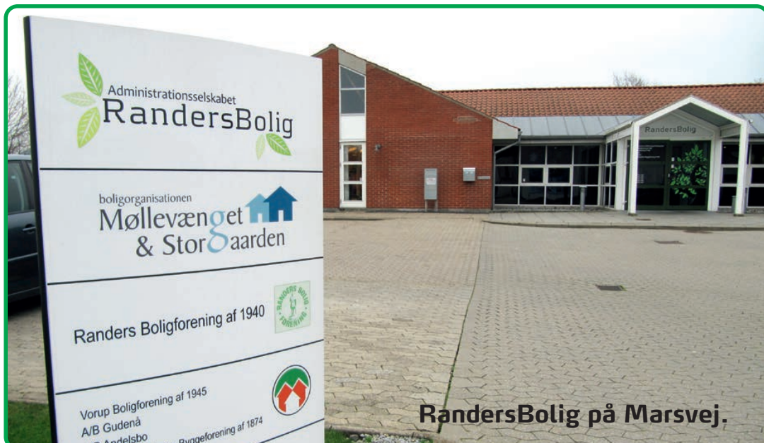
RandersBolig på Marsvej.