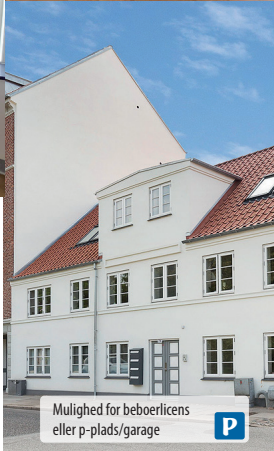
Mulighed for beboerlicens eller p-plads/garage P