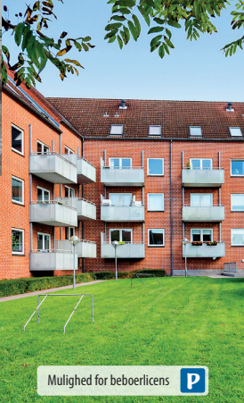
Mulighed for beboerlicens P