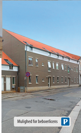
Mulighed for beboerlicens P